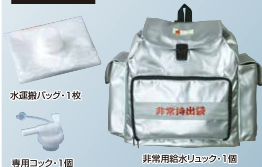
水運搬バッグ・1枚